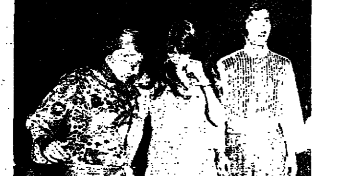
جانب من الحضور في حفلة «دير الحرف»